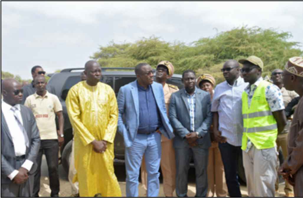
Visite des chantiers inachevés de l'UGB